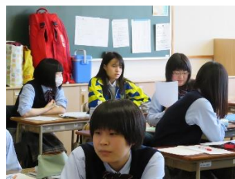
それぞれのクラスの授業に参加