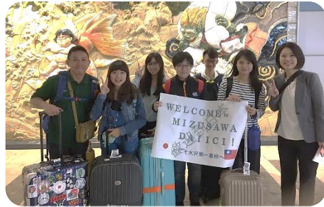
2017年5月17日来日・来校 ドキドキしながら、ホストファミリーとの初対面!