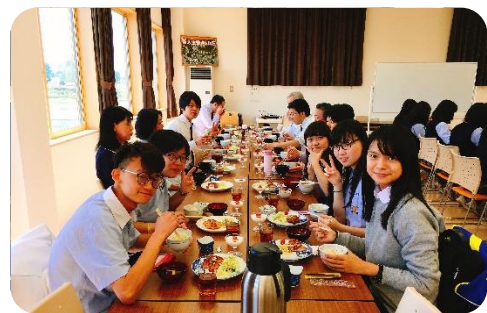
調理科3年生の作った給食を