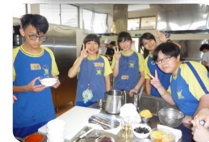
手巻き寿司づくりに挑戦