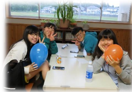
放課後ラウンジで談笑